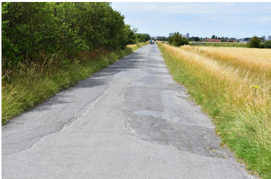
Wegdek bij het kruispunt met de Klemskerkestraat