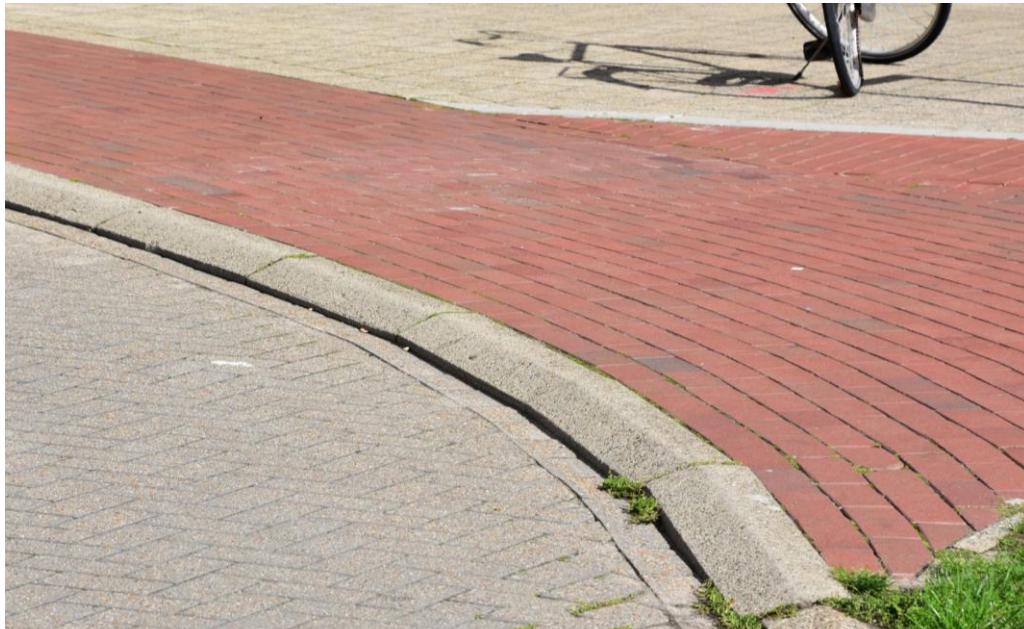
Detail van de hoge boord waar de fietser het fietspad op en af moet rijden.