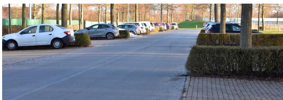
Massa parking voorzien voor de auto's.