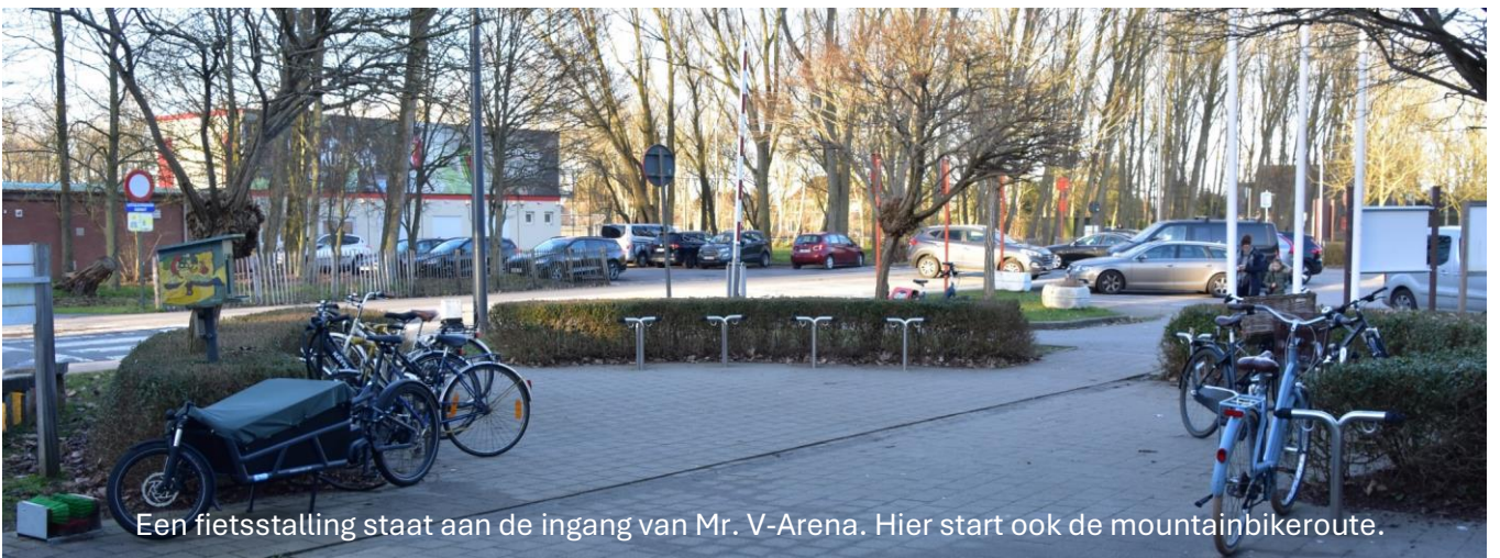
Een fietsstalling staat aan de ingang van Mr. V-Arena. Hier start ook de mountainbikeroute.