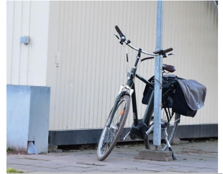
Overall in het sportpark staan fietsen tegen palen, muren en hekkens.